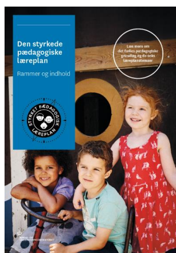
Den styrkede pædagogiske læreplan, Rammer og indhold

Denne skabelon indeholder alle de lovmæssige krav til evalueringen. Lovkravene finder I i de to midterste afsnit "Evaluering og dokumentation" og "Inddragelse af forældrebestyrelsen". Skabelonen indeholder desuden spørgsmål, som kan støtte jeres evalueringsproces samt jeres fremadrettede arbejde med løbende at revidere den skriftlige læreplan.